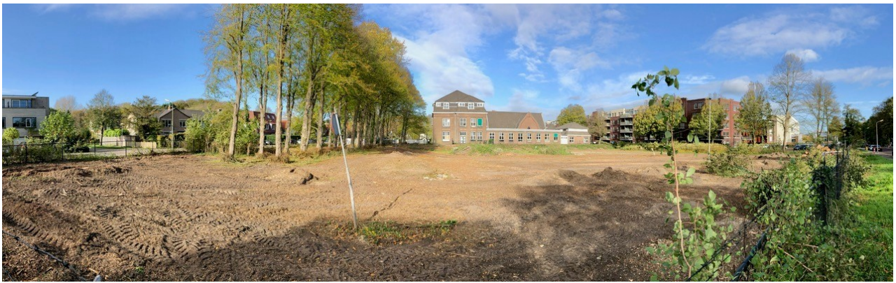
Een groot deel van de 'groene omlijsting' is verdwenen. Tientallen bomen en struiken zijn gekapt om straks plaats te maken voor de nieuwe woningen en de nieuwe lindes en andere inheemse boomsoorten.